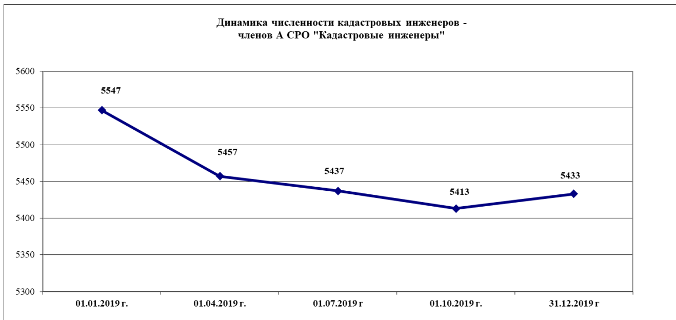
Рис. 1. Динамика численности кадастровых инженеров А СРО «Кадастровые инженеры» в течении 2019 года