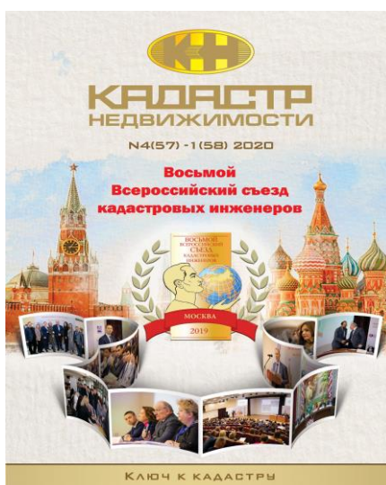
Рис. 3 Журнал «Кадастр недвижимости» 2019 г.

Сайт А СРО «Кадастровые инженеры» https://www.roscadastre.ru/ продолжает информировать кадастровых инженеров – членов Ассоциации об изменениях в законодательстве, о правовой позиции Росреестра, других государственных структур и органов власти по различным вопросам в сфере кадастровой деятельности, о проводимых Ассоциацией мероприятиях, а так же оперативно доводить до сведения членов Ассоциации важную информацию. Ежедневно сайт посещают свыше 1000 заинтересованных лиц.