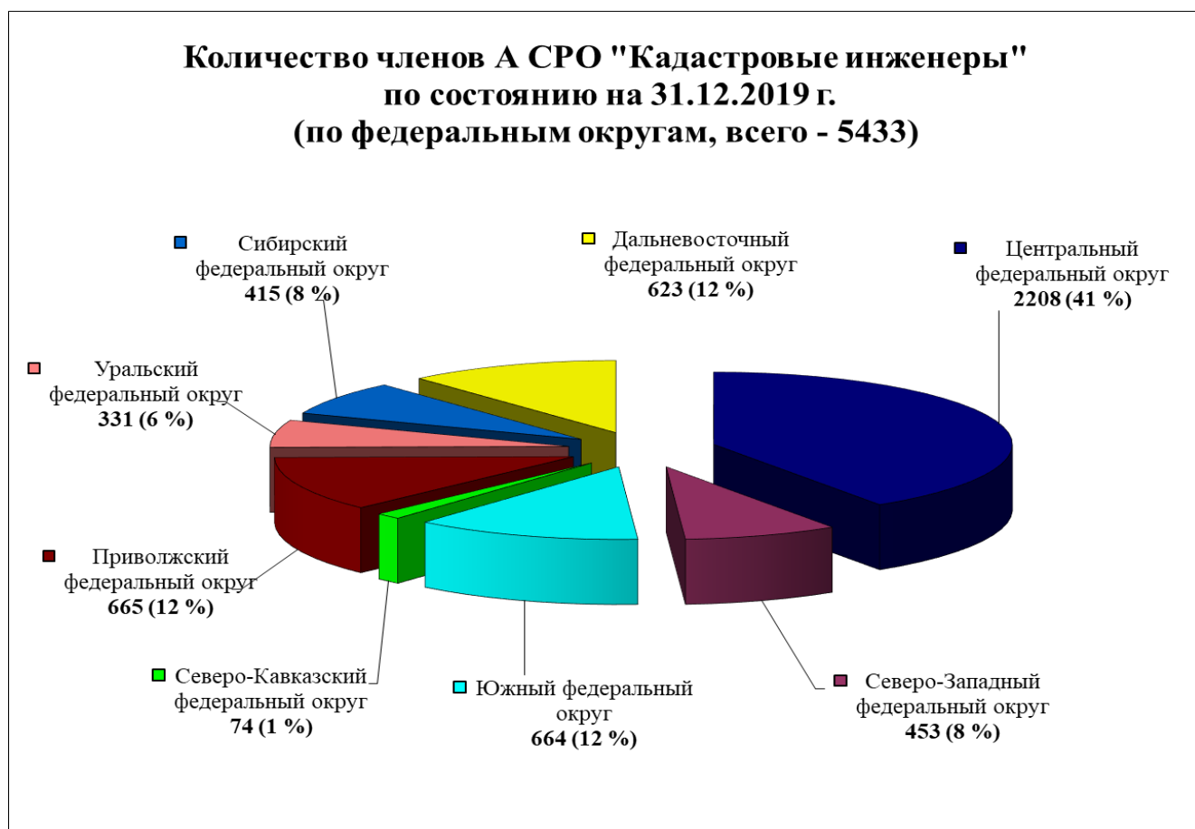
Рис.2. Количество членов А СРО «Кадастровые инженеры» по Федеральным округам

Из приведенных данных видно, что 4 % исключенных кадастровых инженеров вновь вступили в члены А СРО «Кадастровые инженеры», почти 20% вступили в члены Ассоциации «ГКИ». 55% исключенных кадастровых инженеров не вступили ни в какое иное СРО, большая часть из них не имеет высшего профильного образования.